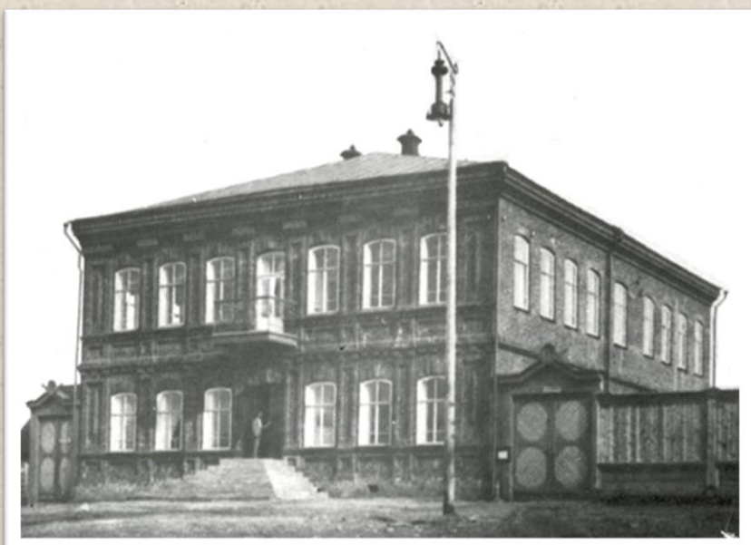
Культпросветучилище, г. Сатка, 1950 год

История становления культпросветшколы (КПШ) – Челябинского культпросветучилища (КПУ) – Челябинского колледжа культуры (КК) – колледжа культуры ЮУрГИИ