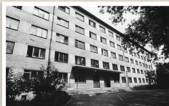
Кудрявцева, 30 (на 632 места)