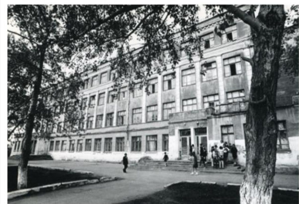
Школа № 9, г. Челябинск, 1952 г.